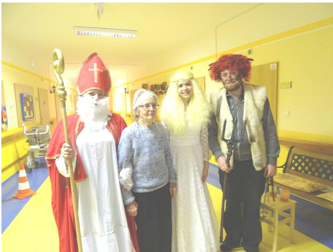
NÁVŠTĚVA MIKULÁŠE, ANDĚLA A ČERTA