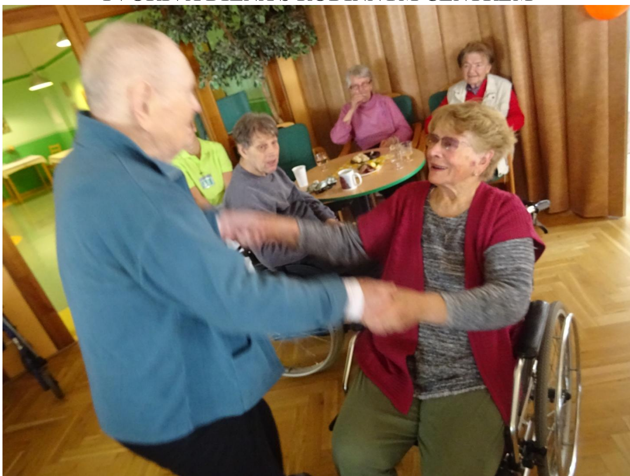
OSLAVA 11. VÝROČÍ SOCIÁLNÍCH SLUŽEB LANŠKROUN