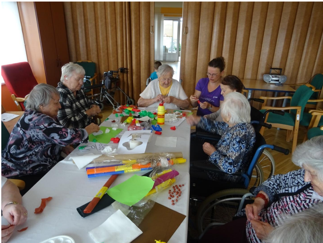
TVOŘIVÁ DÍLNA S RODINNÝM CENTREM