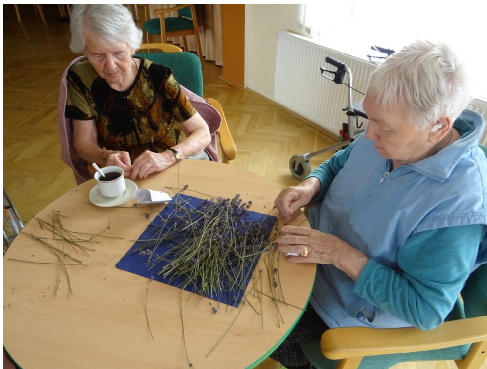
KAVÁRNA V PROVENCE

Cimbálková muzika zvedla k tanci několik klientů a většina zpívala společně s kapelou známé lidové písně. Tyto skvělé podmínky tak daly vzniknout jedinečné akci s jedinečnou atmosférou. Největší odměnou byl pak úsměv na tvářích našich klientů.