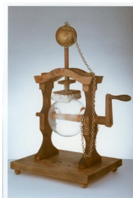
Obrázek: Elektrum Prokopa Diviše (replika třecí elektřiny)

Prokop Diviš zemřel 21. prosince 1765 v klášteře v Louce u Znojma. Dnes je právem řazen mezi vědce světového významu.